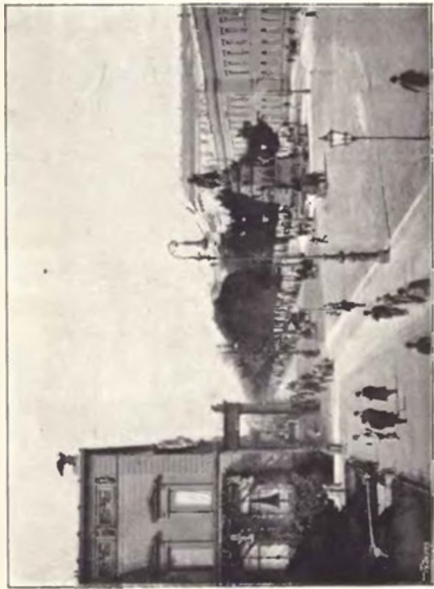
Berlin: Pod lipami.