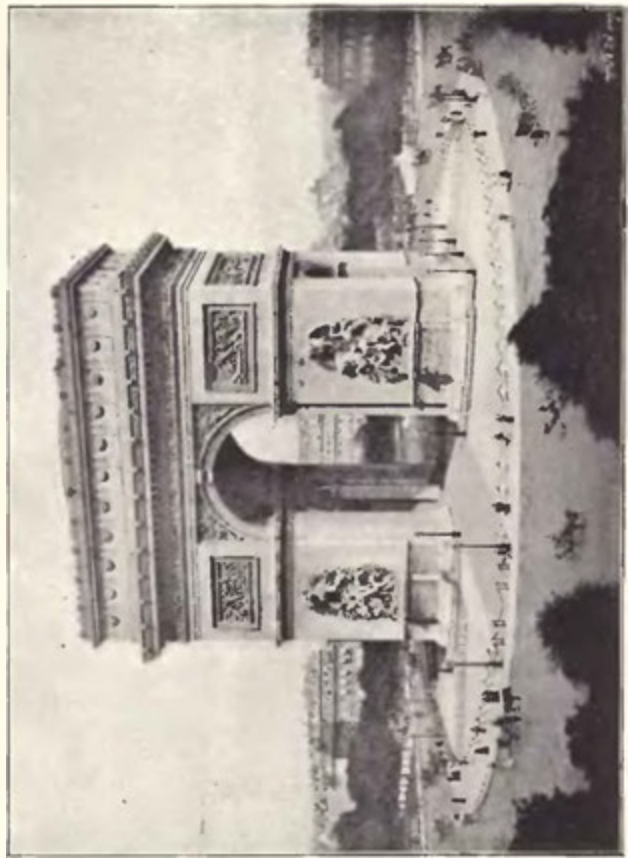
Paříž: L'arc de triomphe de l'étoile.