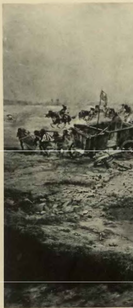
vođa iz Tampaco.