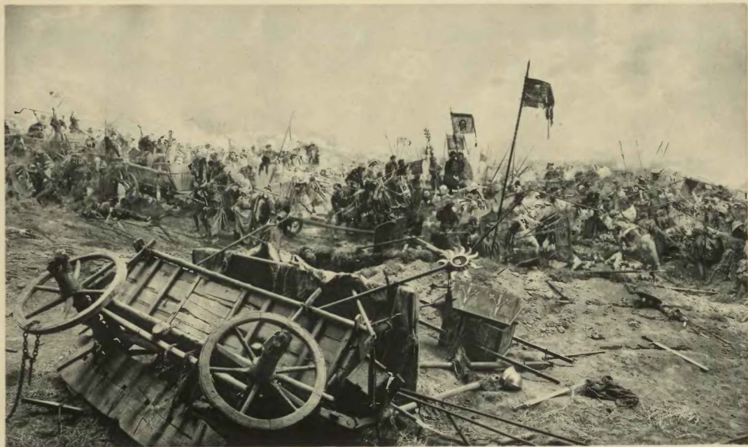
Табір на марші вояків.

Битва під Бірчатою між козаками і кіннотою польською. Місяць травень і червень.