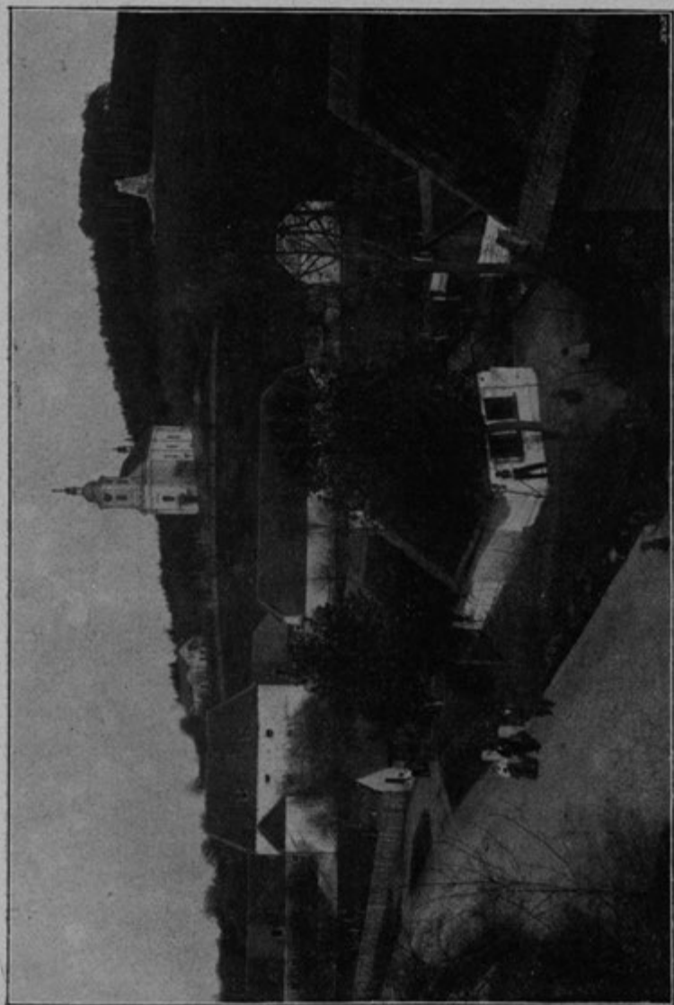
Bývalá tvrz, nyní panská sípka.