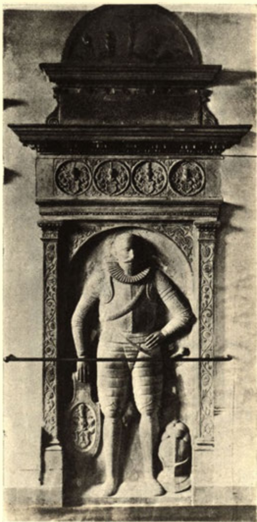
Řada hrobek Zikmunda st. Sedlnického z Choltic na Neuhubli ř 1602.