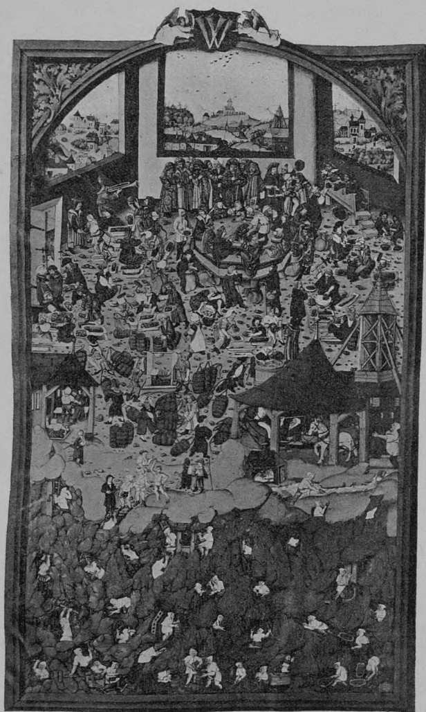
Titulní list kutnohorského gradualu Matouše illuminátora (znázorňující práci v stříbrných dolech i činnost nad doly).