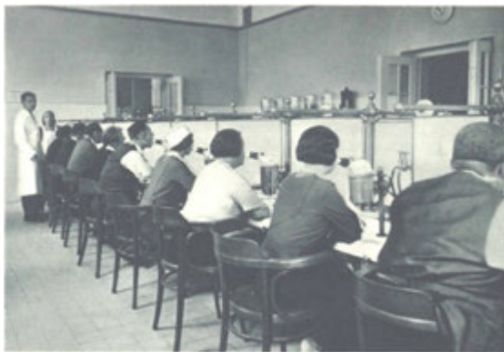
U inhalačních přístrojů.

Kč 3.— za den. Při pobytu přes 3 do 14 dní se platí za osobu Kč 75.—, do 4 týdnů Kč 100.— a za každých dalších 14 dní Kč 25.— lázeňské taxy. Rodiny, sestávající z více než 3 členů lázeňskou taxou povinných, platí za každého dalšího svého člena pouze polovinu taxy. Osoby služební, jsou-li přítomny v lázních se svým zaměstnavatelem, platí rovněž polovinu taxy. Na předložený doklad o majetkových poměrech, úředně ověřených, na př. vysvědčení chudoby, lze dosáti slevy.