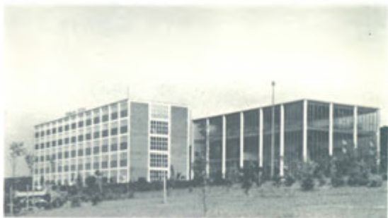
Studijní ústav a památník.