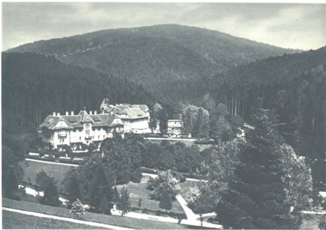
Proslulý ústav vodoléčebný s lázněmi slatinnými, sírnými, říčními atd.