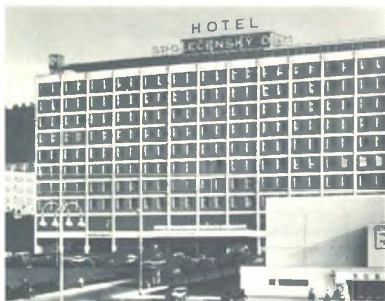
Hotel Společenský dům.