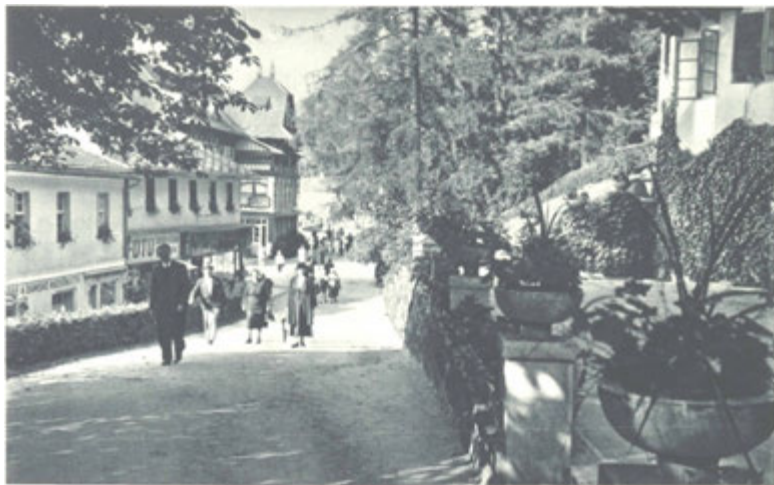
Vstup na lázeňské náměstí k léčivým pramenům pitným.

krevnost, dna, kornatění tepen, srdeční vady, vady organické, kompensované atd. se sníženým neb zvýšeným tlakem krevním, rekonvalescence po těžkých operacích a po infekčních chorobách, zejména po chřipce, bronchitidách, pohrudničních zánětech, potom nervové poruchy zbylé po chřipce, reumatismus, ischias.