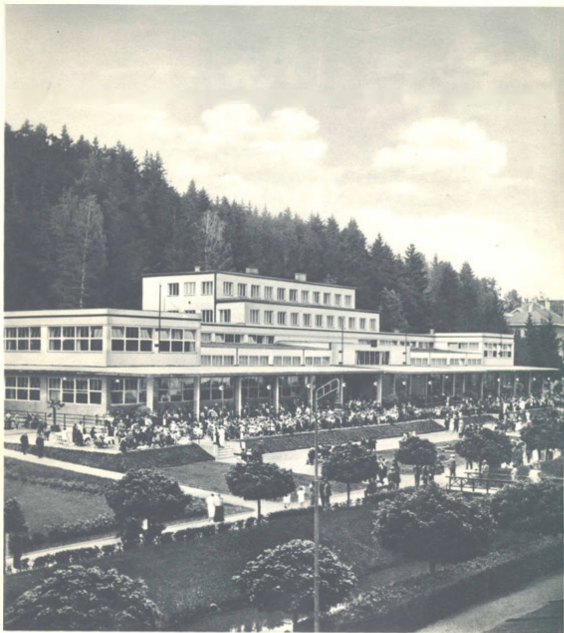
Společenský dům, středisko lázeňských hostů.