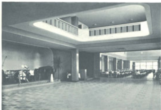
Taneční parket a restaurace Společenského domu.

Doporučujeme lázeňským hostům, aby nejprve písemně oznámili správě lázní své požadavky, přání (na př. počet lůžek, dobu pobytu atd.), správa lázní nabídne jim pak několik bytů, z nichž si mohou vybrati. Po objednávce a zaslání příslušné zálohy je byt zajištěn pro stanovenou dobu. Kdyby snad lázeňská správa neměla v hlavní sezoně ve svých budovách vhodného bytu, pak doporučí žadateli byt v soukromém domě nebo vile.