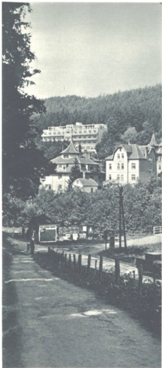
Partie z Pražské čtvrti, v pozadí »Miramontis«.

Kamennou, Obětovou a Jestřabím je krásná plovárna s velkým basénem, rozděleným ve dvě části: pro plavce a neplavce. Plovárna tak právě jako velké sluneční lázně, umístěné hned vedle ní, lákají k sobě milovníky slunce, vody a vodních her. Pro veslaře se výborně hodí údolní přehrada přes 1 km dlouhá a skorem půl kilometru široká.