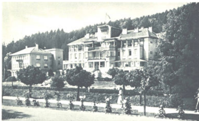
Dům Bedřicha Smetany a Správa Lázní.

žaludeční choroby, zácpa, kaménky, vleké horečky, bolení hlavy, sešlost, zadrženi moče následkem vředů měchýře, hysterie, neplodnost a časté potraty. Všechny tyto nemoci se uvádějí v souvislost s větší či menší produkcí hlenů, které luhačovické vody snadno rozpouštějí. Voda se pila buď čistá, nebo smíchaná s žinčicí, malinovou šřávou, syrupem ze sladkovcového kořene, medem atd. Koupání ve vodě se počalo až v roce 1790, kdy dal postavit tehdejší majitel Vincenc hrabě Serényi první koupele.