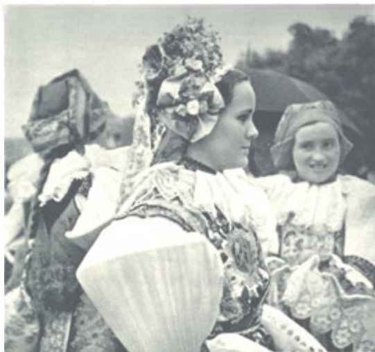
Nevěsta v kroji z okolí Luhačovic.

Luhačovice jsou nejen lázně vysoké hodnoty léčivé, s jedinečnými přírodními krásami, ale také lázně, které vyhoví požadavkům všech vrstev.