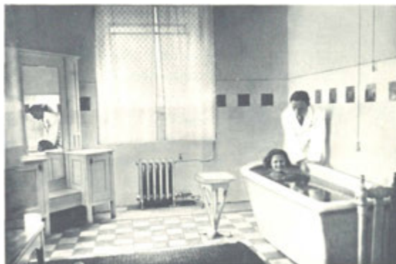
V minerální lázni.

Okolí Luhačovic vyniká přírodními krásami, neboť jsou tu malebná pohoří, údolí, návrší, skaliska i zříceniny hradů. Je to zároveň i kraj národopisně zajímavý, tvořící přechod mezi Slovákem a Valašskem. Každá vycházka, výlet a zájezd do blízkého nebo vzdáleného okolí přináší nejpříjemnější požitky. Nejvděčnější zájezdy jsou do Zlína, na Buchlov, Velehrad, do Vlčnova,