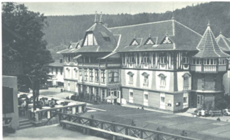
Budova přírodních uhlíčitých lázní.