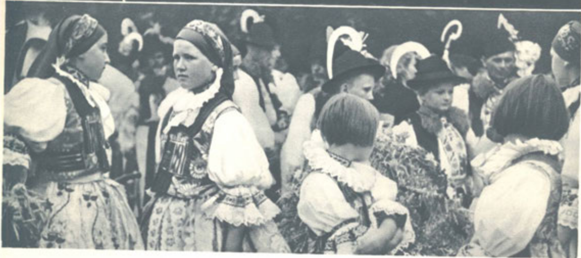
Luhačovice a jejich folklor.