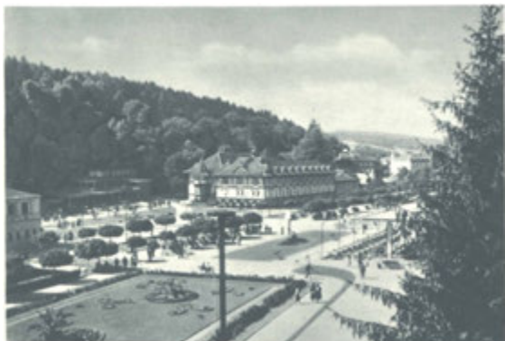
Lázeňské náměstí před Společenským domem.

Mimo lázeňský střed jest v Luhačovicích množství hotelů, pensionů, soukromých vil se 4.500 pokoji s 6.000 lůžky za nejrůznější ceny.