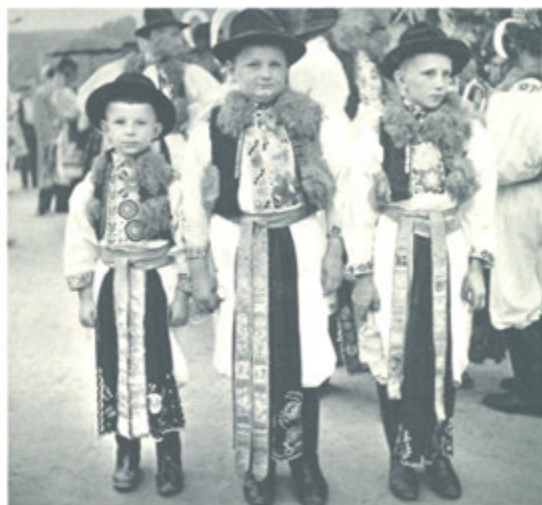
Šohají z okolí Luhačovic na promenádě.

Aby lázeňská léčba mohla býti použita nejširšími vrstvy, i sociálně slabšími, jsou v době mimo hlavní