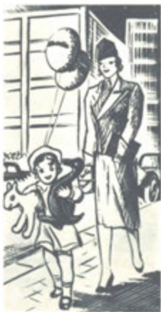
Odchod z prodejny.