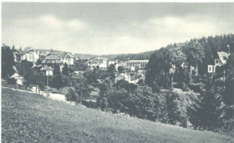
Pohled na »Pražskou čtvrť«.

V sezoně se předvádějí v lázeňském divadle činohry, operety a opery nejlepšími uměleckými soubory, každého roku jsou tam hosty významní umělci hudební, často světového jména. V salonech lázeňských restaurantů se pořádají reuniony, společenské večery, módní přehlídky, taneční závody. Každého roku se konají v lázních velké automobilové turnaje, květinová korsa, soutěž elegance, dětské slavnosti s různými závody, koňské dostihy, sokolské a národopisné slavnosti.