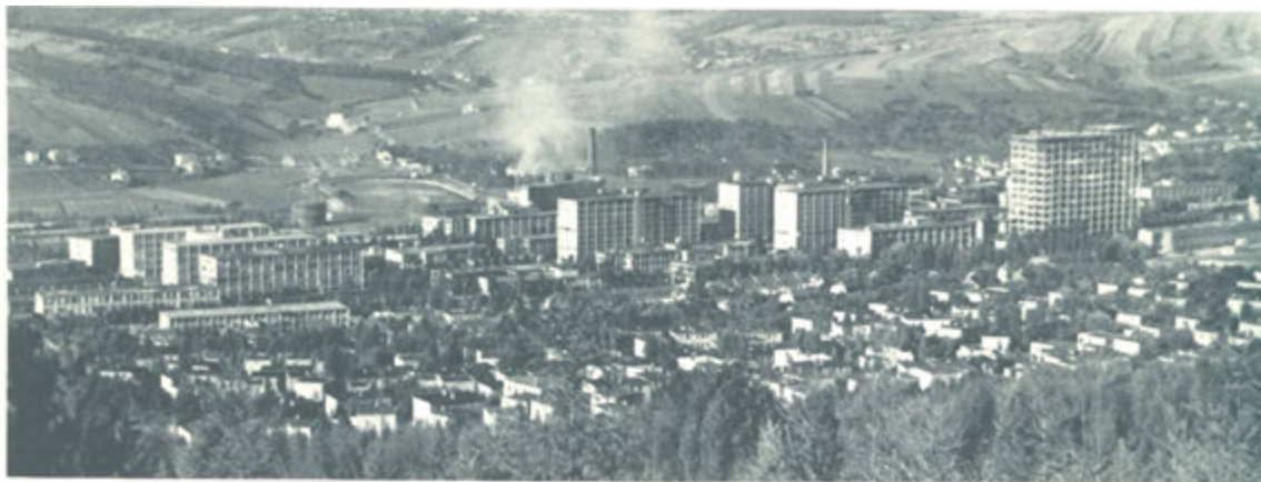
Celkový pohled na Zlín.