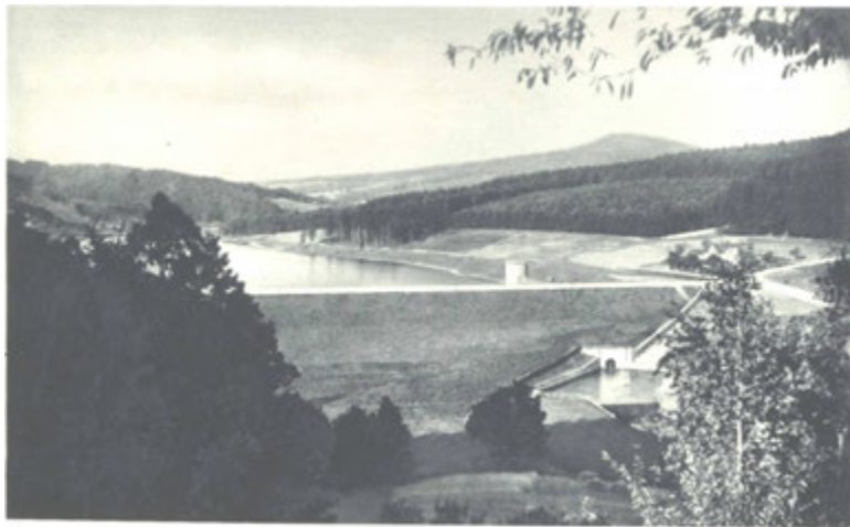
Údolní přehrada. - Středisko vodních sportů.