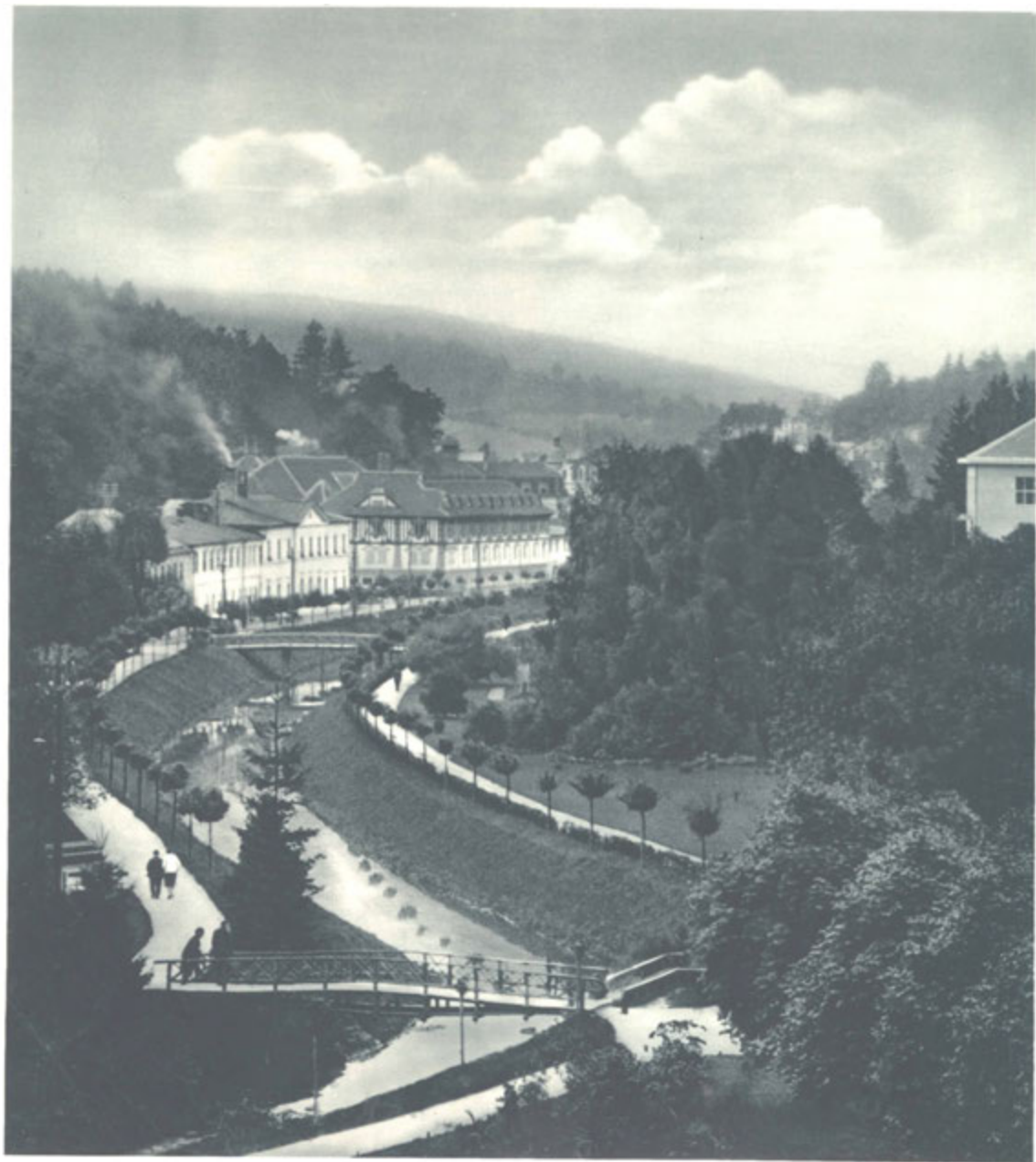
Pohled do údolí lázní.