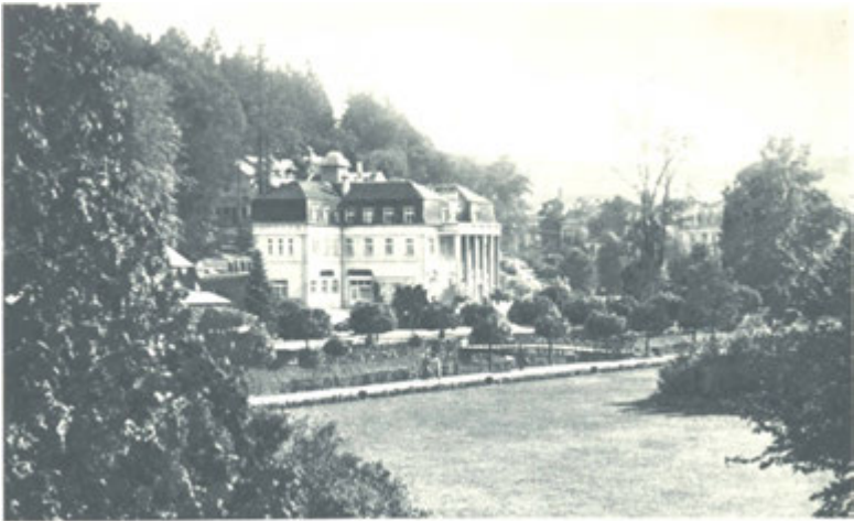
Světově známé inhalatorium s pneumatickými komorami.

Luhačovickou vodu pijeme buď čistou, nebo s mlékem smíchanou, nebo také teplou. Množství vody určí lékař, stejně jako prameny. Tisíce nemocných se podrobují denně pitné léčbě nejen v Luhačovicích, ale také i ve svých domovech, kde si kupují luhačovickou vodu v lahvičkách, a to v lékárnách, drogeriích a obchodech. Mnozí pacienti nezapomínají ani doma na inhalování a kloktání, vhodně to vše doplňují užíváním »Minerálků« zdravotních pastilek, vyrobených ze solí luhačovických vod. Soli samé pak v roztoku inhalují, resp. roztokem kloktají. O podrobnostech této domácí léčby