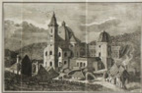
Chiesa di S. Maria, M. S. Maria