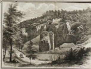
Monte S. Maria, M. S. Maria