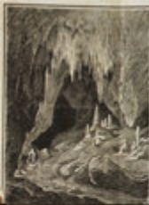
Interno di grotta di M. S. Maria