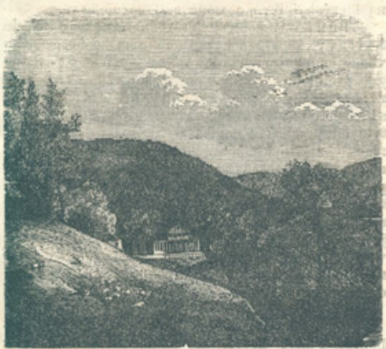
Klepáčovský hostinec blíž Blanska.

Z Adamova za půl hodiny přibude vlak Brněnsko-Pražský vedlé nové knížecí Salmské vy-