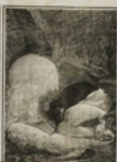
Interno di grotta di M. S. Maria