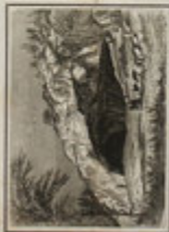
Interno di grotta