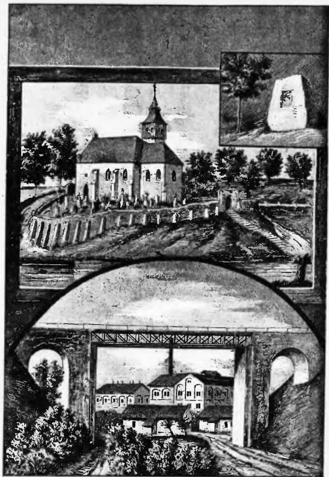
Kostel sv. Ducha.