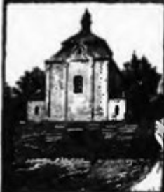
Knih- a kamenotiskárna. Kaple sv. Jana Nep.