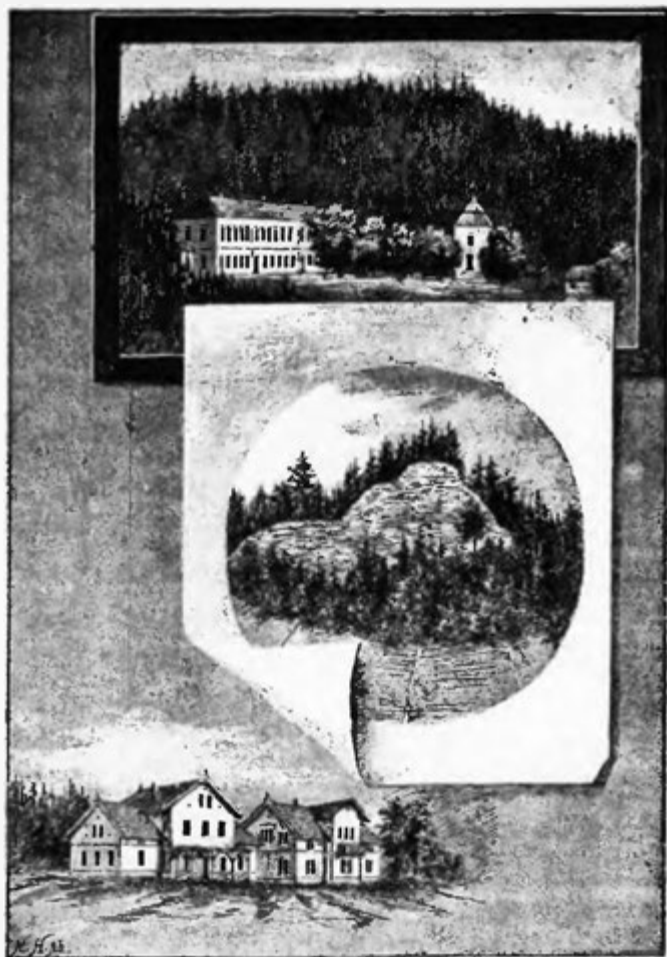
Vily. Rezek. Výrov.