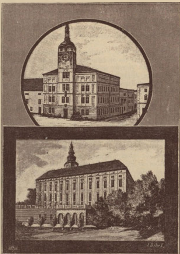
Městská budova, v níž jest c. k. okr. hejtmanství a c. k. okr. soud v Kroměříži na hl. náměstí.