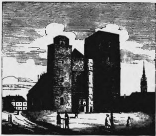
Kostel sv. Mauriciho.

3. Farní a proboštský kostel sv. Mauriciho, 1) největší a uvnitř nejpěknější kostel Olomoucký, s vysokou příkrou střechou, dílem taškami dílem břidlicí krytou, se dvěma kusými věžemi nestejně výšky v průčelí a dlouhou lodí, lomeným obloukem ozdobně klenutou, již drží dvoji řada štíhlých pilířů.