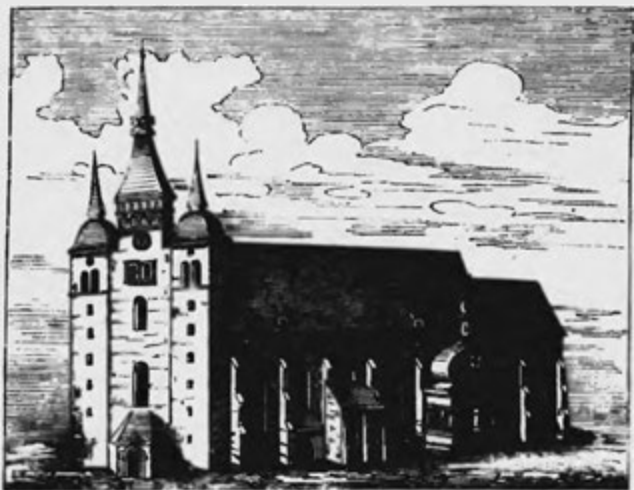
Hlavní chrám sv. Václava r. 1593.

skrze stavitele Bernarta Macha z Mor. Ostravy, a roku příštího dal portál v nynější způsob předělati. Té doby měl chrám sv. Václava vždy ještě poněkud původní podobu, tři baňaté věže napřed a malé nízké presbyterium, jakž viděti na vyobrazení tuto položeném, vzatém z Paprockého Zrcadla markrabství Moravského, vydaného r. 1593.