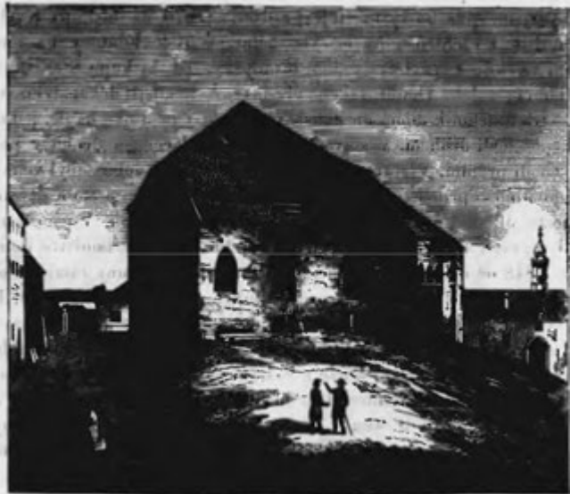
sare Josepho II. (diruto prius et abolito ad s. Jacobum Minoritarum monasterio) excitatum est nosocomium; ipsa vero ecclesia s. Petri, quae prius ante illud

3. Kostel sv. Blažeje na Blažejském plácku blíž kostela sv. Kateřiny. Připomíná se v listech ponejprv r. 1299, byl ale dle způsobu stavení mnohem starší. Měl podobu nepravidelného sedruhnanu, zdi dole z neotesaných hrubých balvanů vystavené, klenutí na šesti neforemných pilířích gotických a vysokou zvonici se třemi zvony. Hlavní oltář byl obrácen k oknu průčelnímu v presbyterium, tak že lid kněze mši sloužícího neviděl.