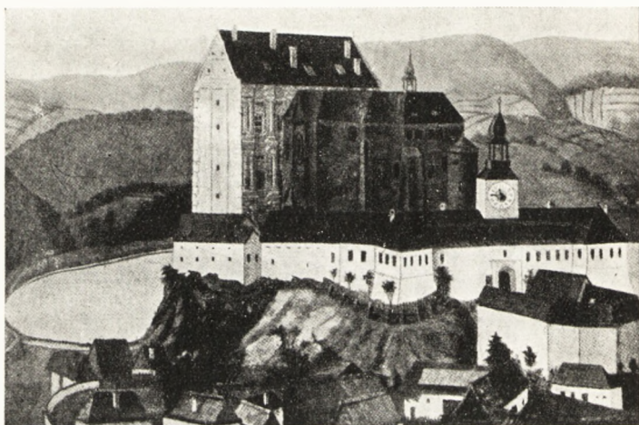
Obr. I. Plumlovský hrad na nádvoří, zbořený pro sešlost r. 1801.

Olejomalba na plechu je uložena na zámku knížete Liechtensteina ve Šternberku. Jméno malířovo je špatně čitelné (asi K. Duka, pinx.). K věži na obraze byly přinýtovány skutečné hodiny s ručičkami, takže jde o nástěnné hodiny obrazové. Stáří obrazu bude třeba určit. Dle scházejících budov na hrázi rybníka, mlýna a pily, bude asi z let 1750-1790. Zdivo hradu je na obraze vyspravované cihlami. Hrad má základy obdélníkové, je vysoký na dvě poschodí a jeho přízemí je kryto nízkým zámekem. Pohled na zámek je se strany severní a východní, kde vidíme kapli. Vchod do hradu byl patrně od západu. Uprostřed hradu bylo malé nádvoří a na něm obvyklá hradní studna. Byla prozkoumána v listopadu 1935 J. Jarolínkem z Prostějova, který se spustil dovnitř otvorem v cihelné klenbě a konstafoval okrouhlou studnu, ve skále vytesanou s kolmými hladkými stěnami o průměru 2.20 m. Studna, jež je nahoře cihlami obezděná a valenou klenbou zaklenutá, je 33 m hluboká, vyschlá a na jejím dně jsou kameny.