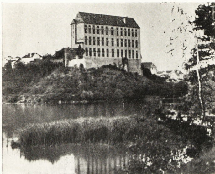
Obr. II. Vysoký zámek z let 1680 s vystupujícími zbytky druhé hradní budovy.

Zpráva o tomto hradě se uvádí v hospodářské bilanci z roku 1791. Je tu zmínka, že na nádvoří je prastarý zámek, vybudovaný v gotickém slohu; v něm byl purkrabský úřad, veřejná kaple, byty pro služebnictvo, sklepy a zaklenutá studna, 44 sáhů hluboká. Velký rozdíl v udávané hloubce 44 sáhů, t. j. přes 83 m, a naměřenou hloubkou 33 m vysvětlíme přepsáním.