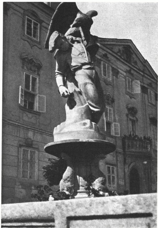
Socha Poroby (Fajt) před radnicí