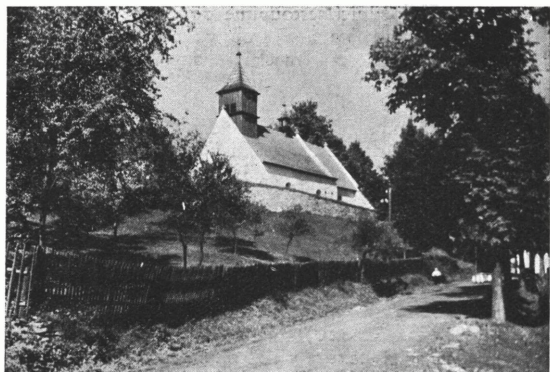
Kostelík sv. Mikuláše ve Starém Svojanově

s kostelem sv. Mikuláše s krásnou klenbou v presbytáři. Kostel byl již r. 1360 farním, od dob husitských je filiálním do Svojanova. Roku 1931 objeveny byly pod omítkou v kněžišti i na stěnách chrámové lodi celé cykly ikonograficky neobyčejně zajímavých nástěnných maleb, zobrazujících život Kristův. Původ jejich je nesporně z polovice XIV. století. Malby byly restaurovány patronem kostela osadou města Poličky uvnitř hradeb. V kostele pochováni jsou někteří členové pánů Zárubů, jimž Svojanov kdysi náležel. Odtud je vzdálena asi 2,5 km Královská Vítějeves, vesnice s 862 obyvateli, s trojtř. školou a se starobylým kostelem sv. Kateřiny, který byl již r. 1350 farním. Staré obecní pečetidlo má kromě nápisu „Peczet obce Witioweské“ uprostřed erb s korunou a v něm monogram K. W. t. j. Král. Vítějeves.