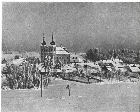
Bystré v zimě

638 m n. moř., vzdáleno 13 4 km jihovýchodně od Poličky, má pětitř. školu obec. a školu měšť., lidovou školu hospodářskou, průmyslovou školu pokračovací a opatrovnu. V místě je pošt. a telegraf. úřad, četnická stanice a občanská záložna.