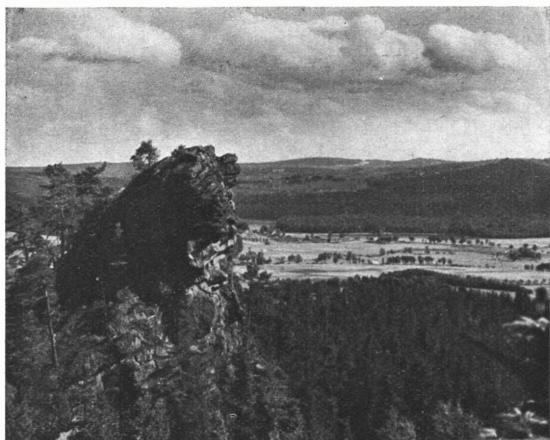
Údolí Svratky pod Čtyřpaličatými skalami