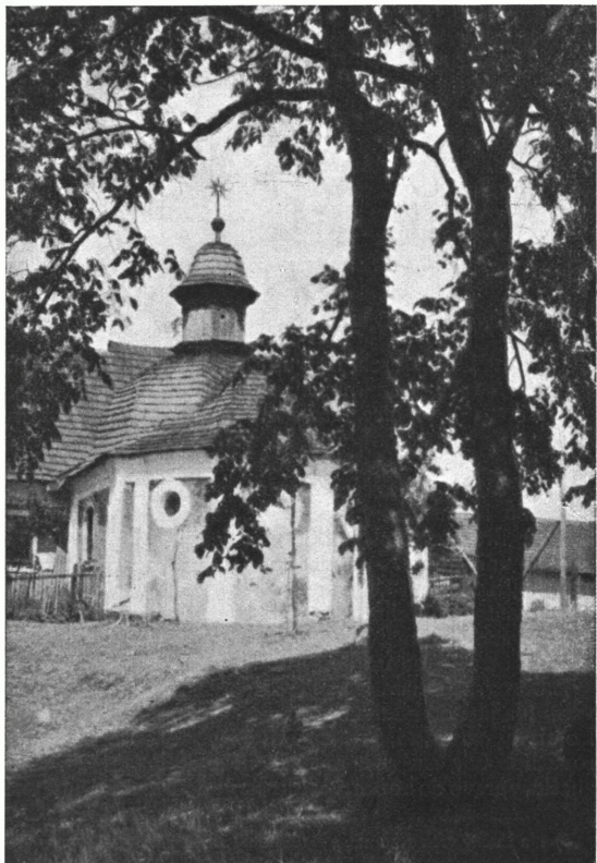
Kaplička na Karlštejně u Svatky