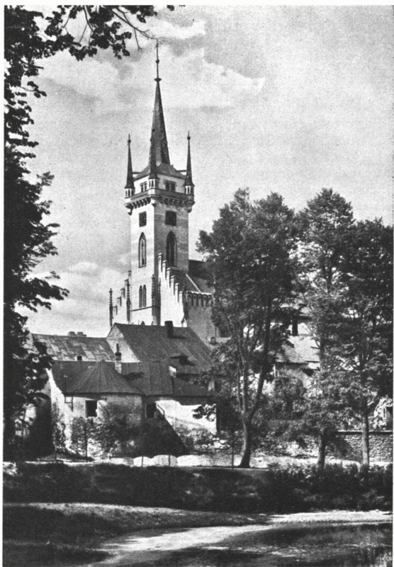
Polička: Na valech