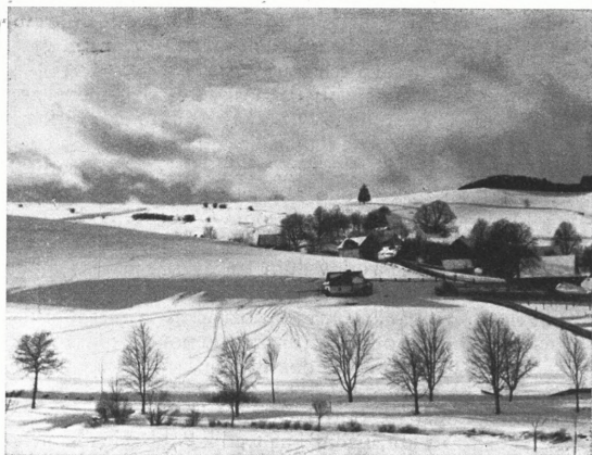
Zima v Krásném