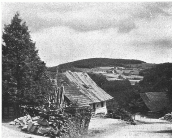
Chalupa ve Spělkově