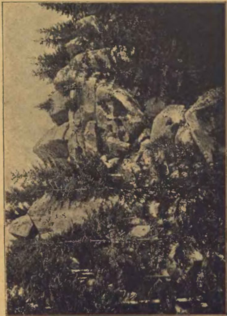
BABINEC U LACHMANOVY JESKYNĚ.