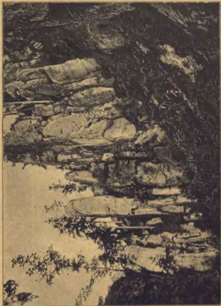
POHLED Z DRUHÉ POKOVKY.