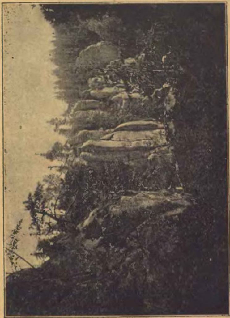
NA VODÁCH POD HRÁDKEM.