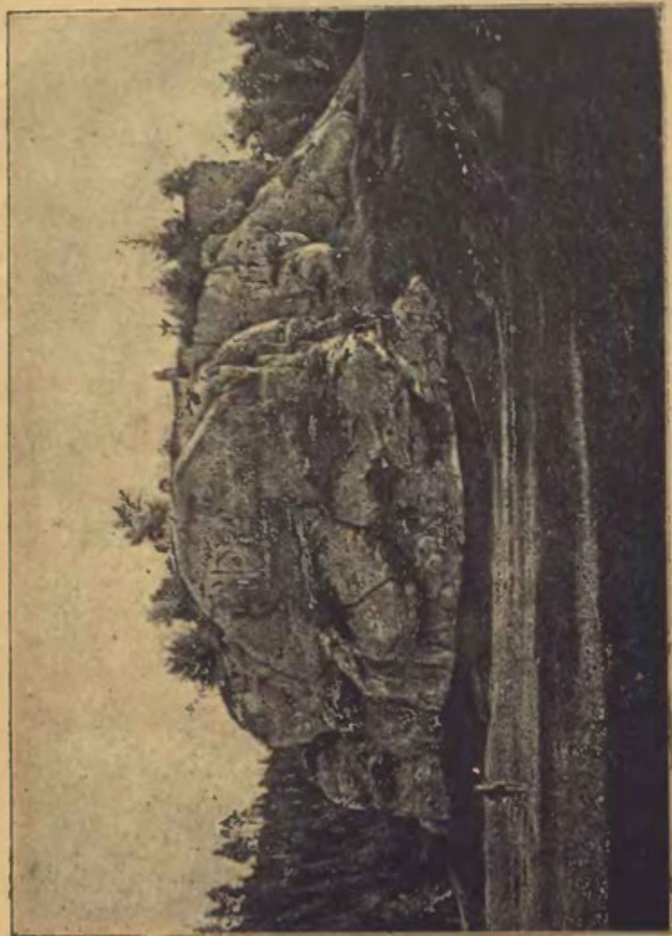
HRAD PÁŘEZ OD SEVERU.