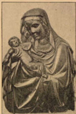
Panna Maria Staroboleslavská.

Když r. 1555 přišel řád jezuitský do Čech, věnoval nemalou pozornost st. Boleslavi a od r. 1567 dojížděli často jesuiti do St. Boleslavi, kdež konávali nadšená kázání. Mimo to velice horlivě se přičiňovali o pořádání poutí na toto místo zvláště z Prahy. Pouti se množily a návštěva St. Boleslavi velice vzrůstala rok od roku, ba jesuitům se podařilo pořádati do St. Boleslavi průvody tak veliké, že se