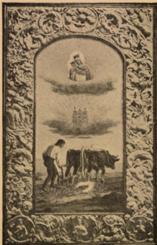
Vyoravač obrazu Panny Marie.