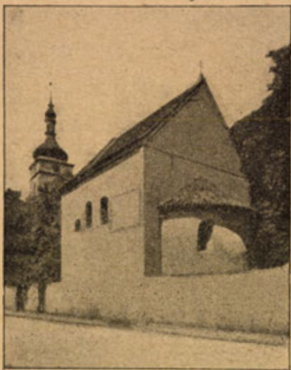
Kostelík sv. Klimenta.

choti sv. Ludmile, kteří vystavěli k jejich počtě na svém bradě ve St. Boleslavi chrám sv., jež dodnes tam stojí. Tato zpráva má svůj důvod v tom, že Bořivoj a zvláště hlubokou láskou ku křesťanství prodchnutá sv. Ludmila po svém křtu jistě si přáli mítí křesťanský kostel, který vzhledem k pohanskému