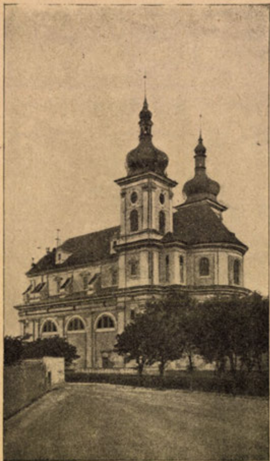
Poutní chrám Panny Marie ve St. Boleslavi.