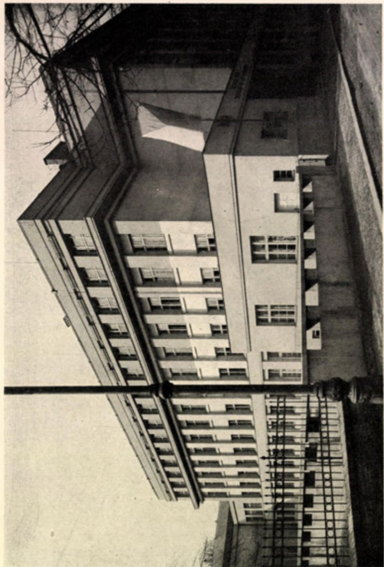
Městské dívčí reálné gymnásium v Praze-XVI.