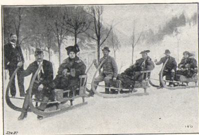
Výlet Českého Ski Klubu do Krkonoš (Špindelmlyn).

Oděv budiž teplý, nepromokavý, při tom však lehký a pohodlný, nejlépe z hlazeného lodenu, na kterém se sních neudrží.