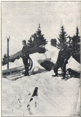
Členové Českého Ski Klubu na vrchu Žalý.

Nansenin, nejlepší dosud známé mazadlo na boty, nepropustí vlhko a noha zůstane vždy suchou. Nansenin, výrobek známé pražské české firmy, zhotoven jest přesně