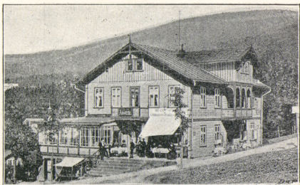
Hotel „Austria“ ve Špindlmlýně.