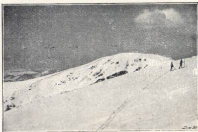
Kotelné jámy. (Alpská tura v Krkonoších.)

Samovar, zhusta se upotřebí, zvláště přijdeme-li do boudy, kde nestává restauračního zařízení.