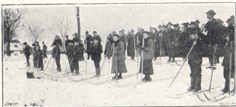
Školní mládež ve Vysokém n. Jizerou.

Při stoupání nutno si právě tak počínati, jak v předcházejících rádkách uvedeno. Jinak ovšem jest,