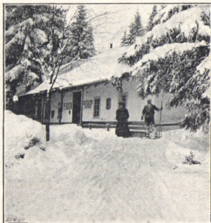
Lyžařská stanice Prokopova na Špičáku (Šumava).

3. Jilemnice, Žalý, Mísečné Boudy, Seifenbach, Harrachov, Nový Svět, Nová Slezská Bouda, Sněžné Jámy,