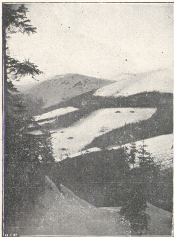
Pohled z Mechovince na Kotel a Misečné Boudy. (Krkonosé.)

Jízda po rovině umožňuje plně oddati se pozorování pohádkové krajiny, ojiněných stromů a keřů, které sníh a mráz přetvořily na různé tvary lidské, zvířecí a p. Vidíme hory oblečené v královský svůj zimní háv, jak odpočívajíce, čekají na první zavanutí jara.