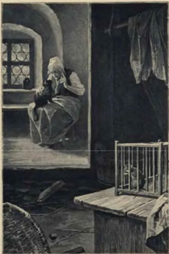
Malá myška ve vězení na celém se třásla těle ... (Str. 20.)