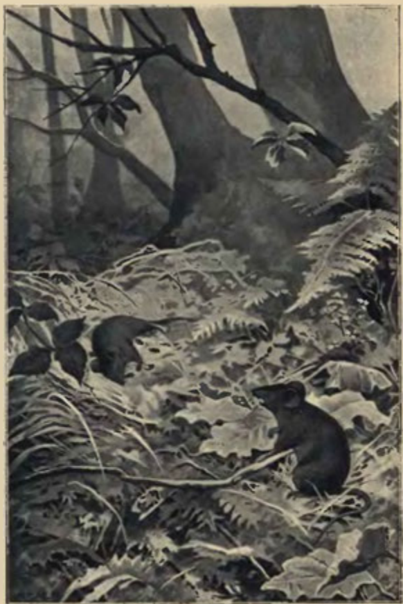
Na trávě mrtvé myšky tlí tu tělo . . . (Str. 11.)