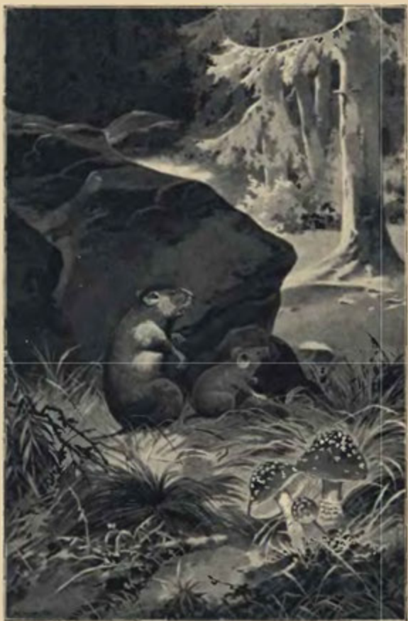
Na mech starý zahnědlý oba tedy usedli . . . (Str. 28.)