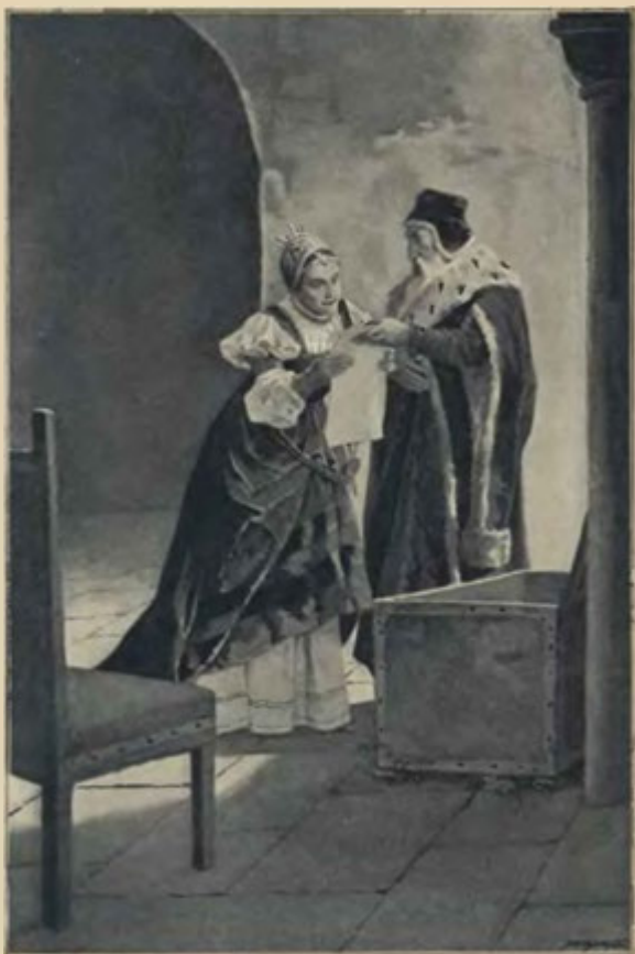
Králové jak žhoucí uhly planul zrak, když dal jí číst . . . (Str. 52.)