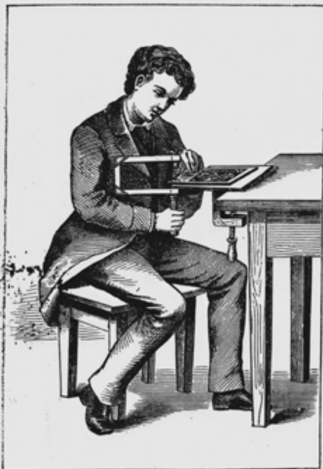
Vyřezávání anglickou pilkou.