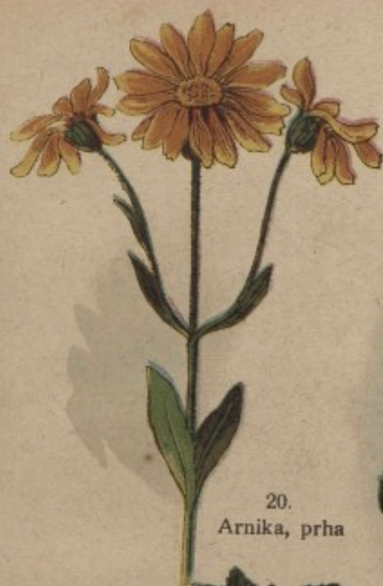
20. Arnika, prha