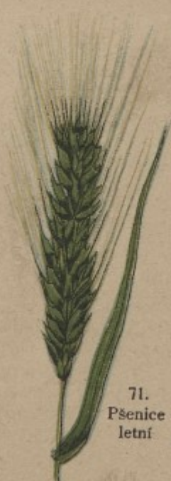
71. Pšenice letní