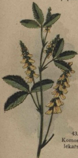
43. Komonice lékařská