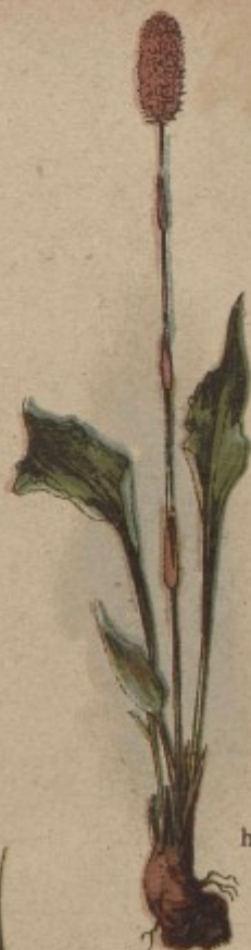
6. Rdesná hadí ko