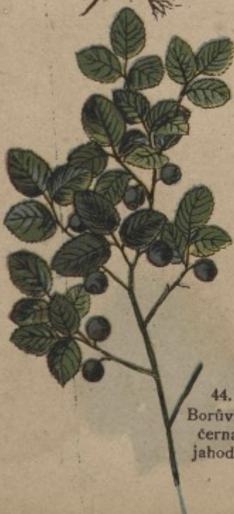
44. Borůvka, černá jahoda