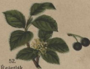
52. Řešetlák počistivý