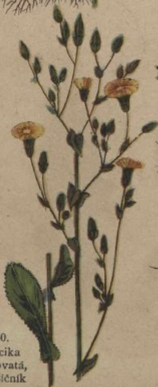
30. Locika jedovatá, mésíčník