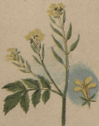
66. Hořčice bílá