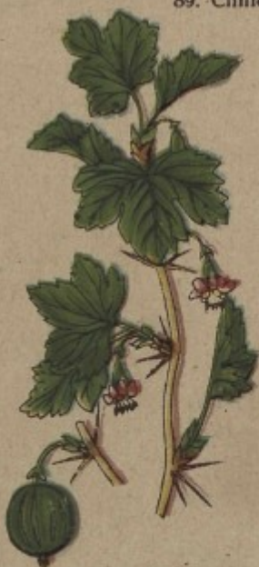
91. Angrešt, srstka