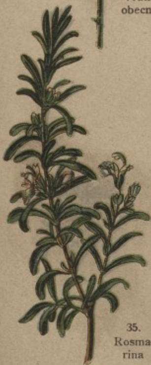
35. Rosma- rina