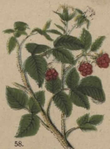
58. Maliník, malina