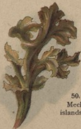
50. Mech islandský