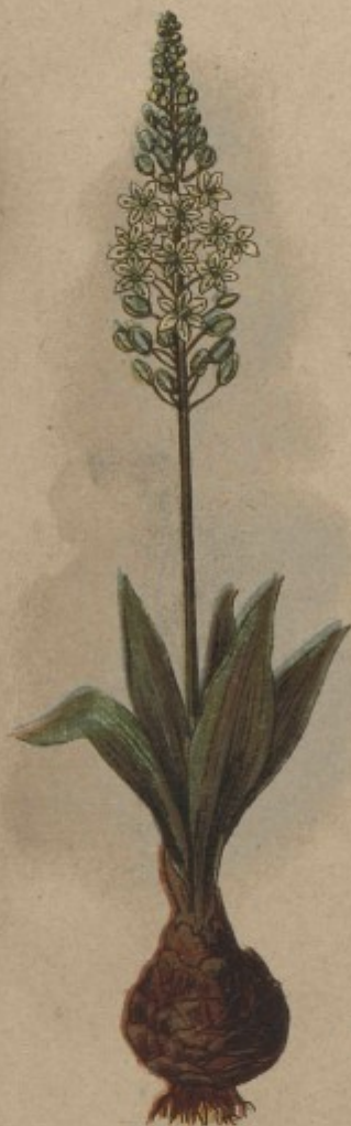
49. Cibule mořská