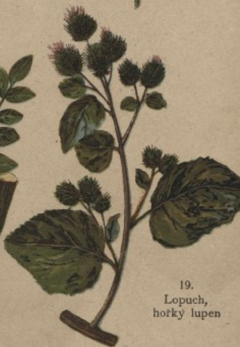
19. Lopuch, hořký lupen