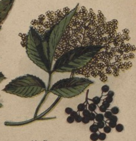
10. Bez černý