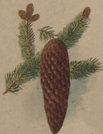
68. Šiška smrková