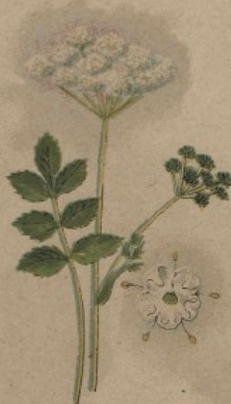
64. Bedrník, třebník