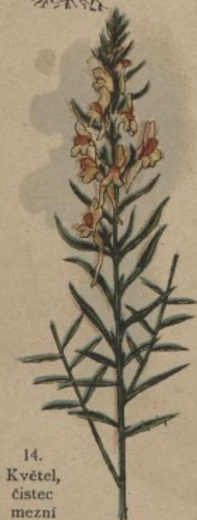
14. Květel, čístec mezní