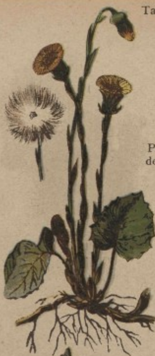
34. Podběl, devětsil