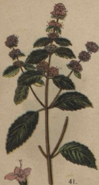
41. Máta peprná