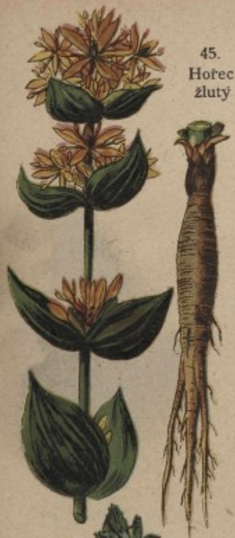
45. Horec žlutý