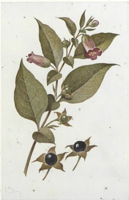
Atropa Belladonna L.