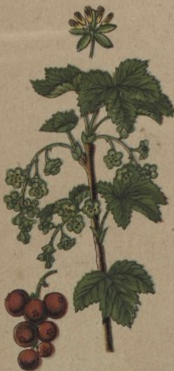
90. Rybíz, meruzalka červená