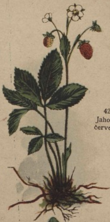
42. Jahoda červená