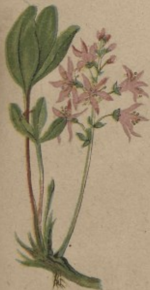
65. Hořký jetel, vachta