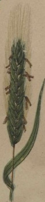
74. Žito v květu