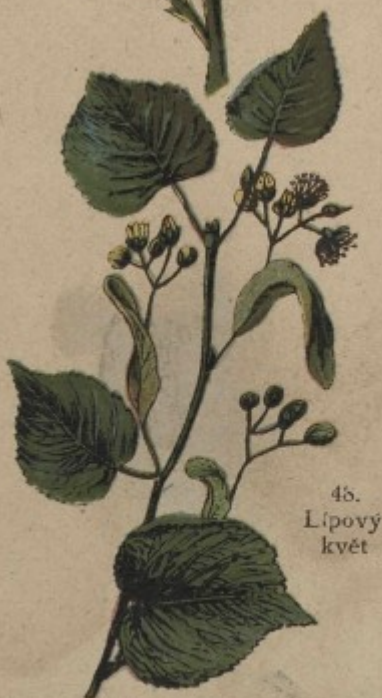
48. Lípový květ