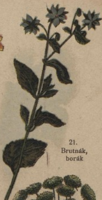
21. Brutnák, borák