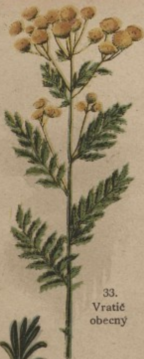
33. Vratič obecný