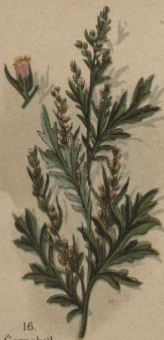
16. Černobýl, pelun černobýl