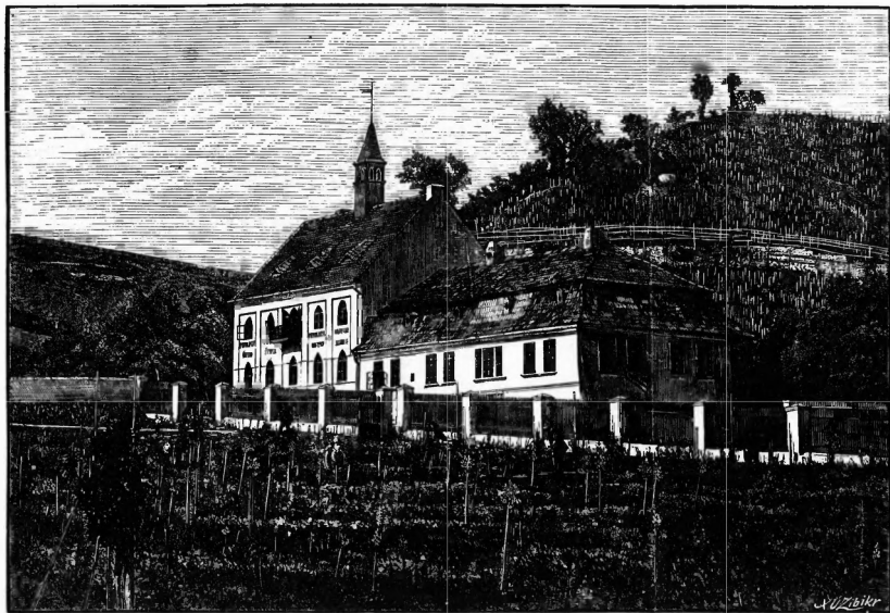
Ovocnářská a vinařská škola v Troji u Prahy.