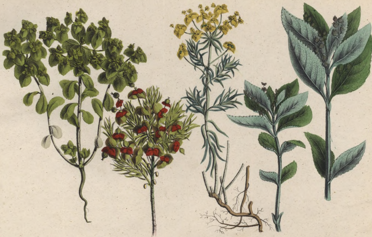
Sonnenwendige Wolfsmilch. Pryšec kolovrátek. Euphorbia helioscopia.