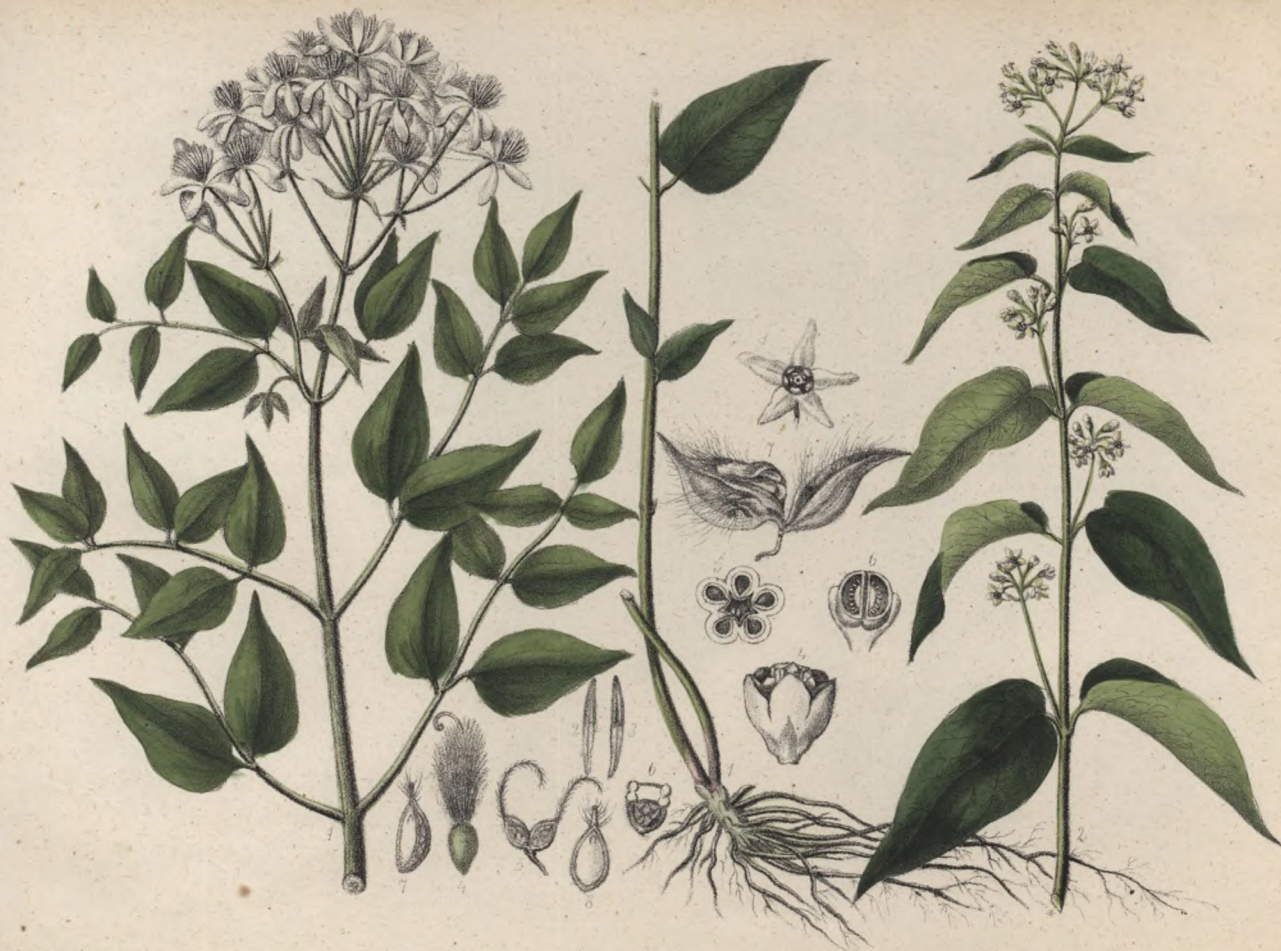
Aufrechte Waldrebe. Pláminek přímý. — Clematis crecta .