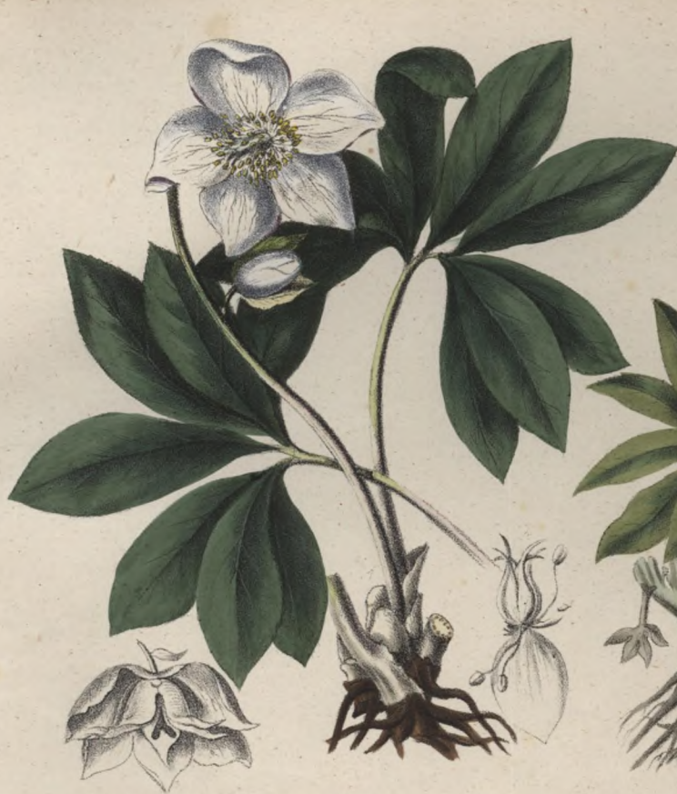
Schwarze Nieswurz. Čemerice černá. — Helleborus niger.