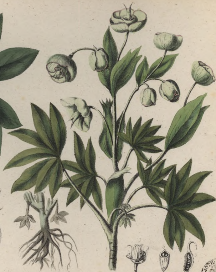
Stinkende Nieswurz. Čemerice smrdutá. — Helleborus foetidus.