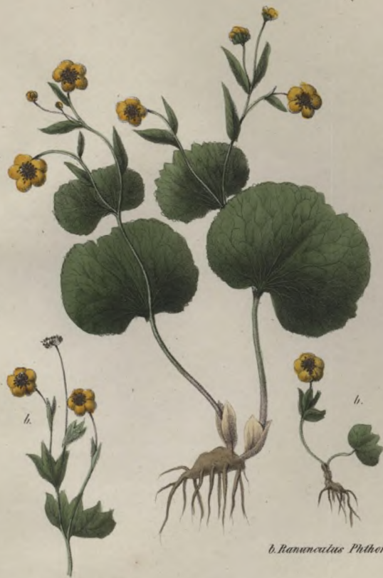
b. Ranunculus Phthera.