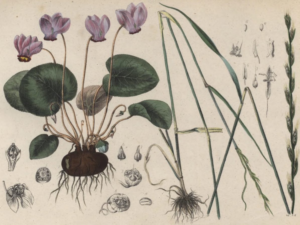
Erdschabe. Brambořík evropský. - Cyclamen europaeum .