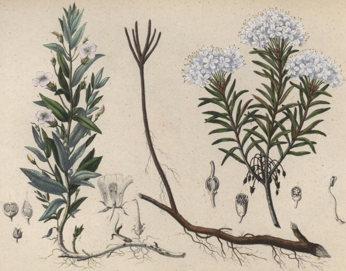
Gnadenkraut. Konitrud lékařský. Gratiola officinalis .