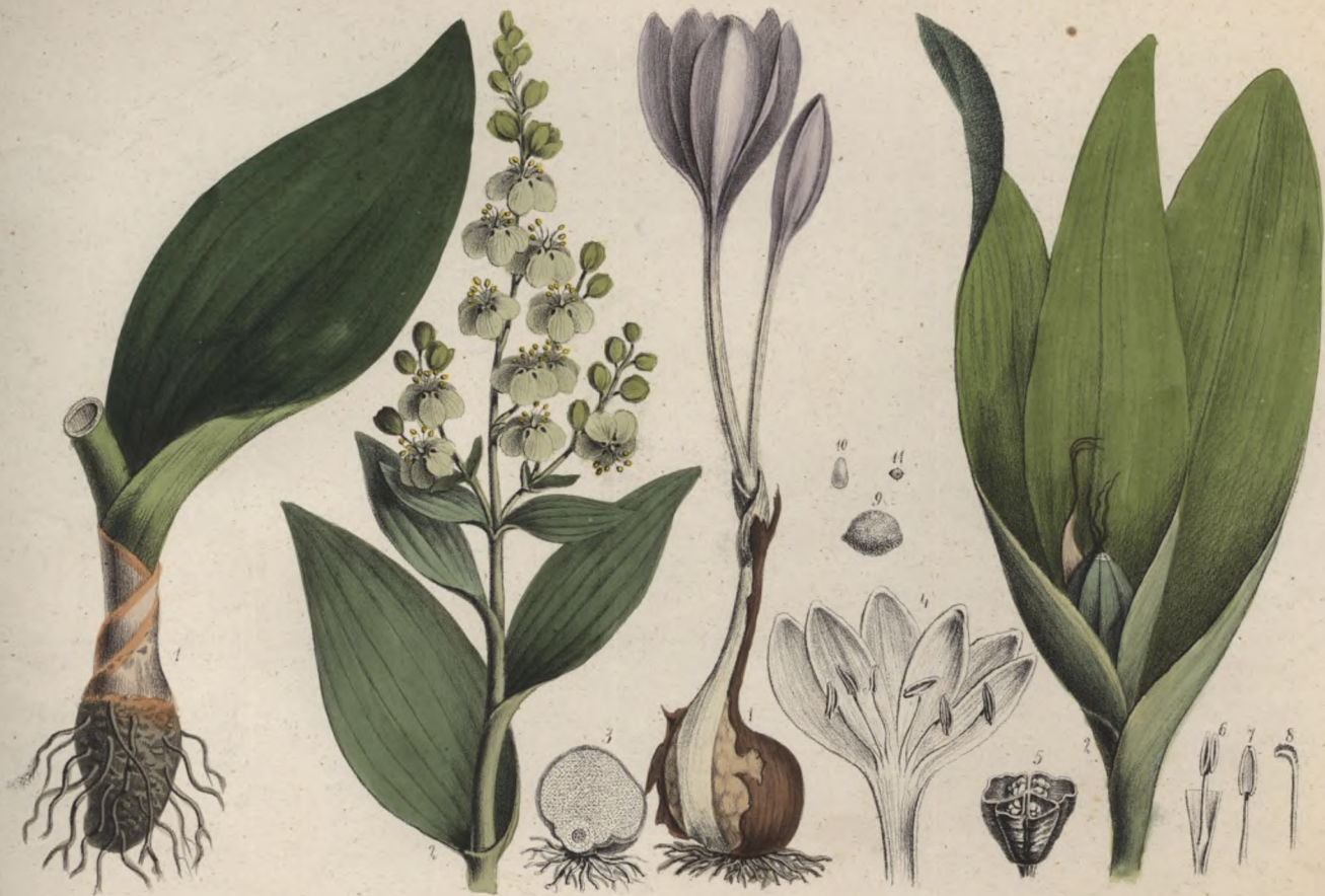
Weiße Nieswurz. Fycharia bílá . Veratrum album .