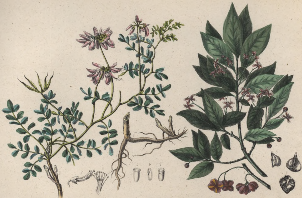
Bunte Kronenwicke Věnečnicka pestrá Coronilla varia.