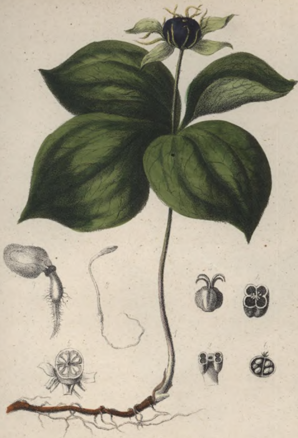
Vierblättrige Einbeere Vranovec čtyřlístý. — Paris quadrifolia