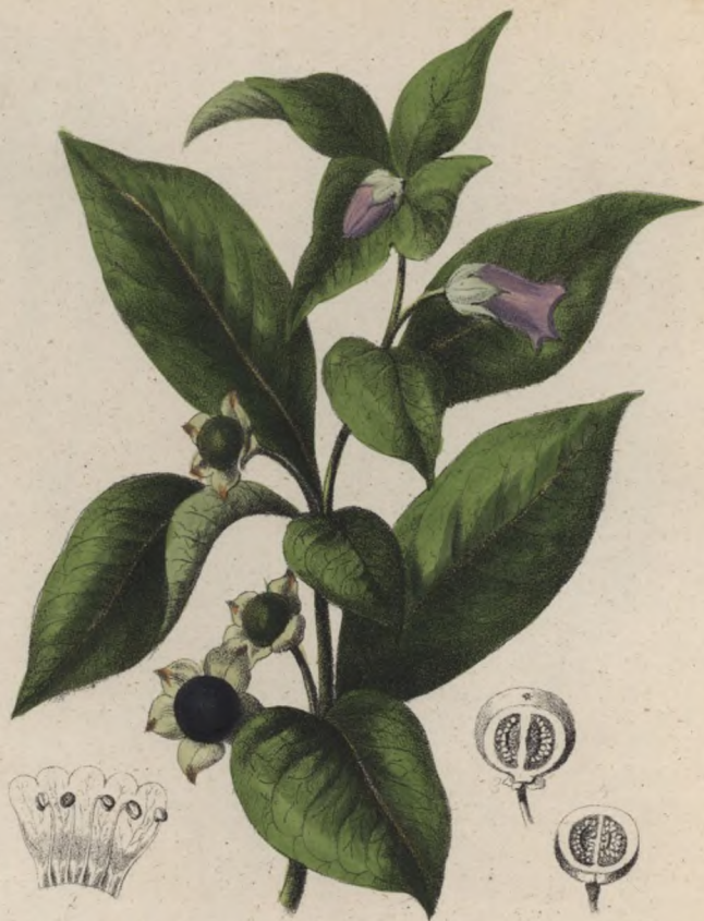
Tollkirsche. Rulík zlomocný. — Atropa Belladonna .