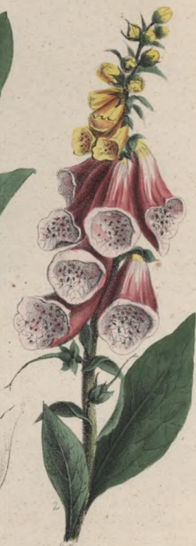
Gelber Fingerhut. Náprstník žlutý— Digitalis lutea .