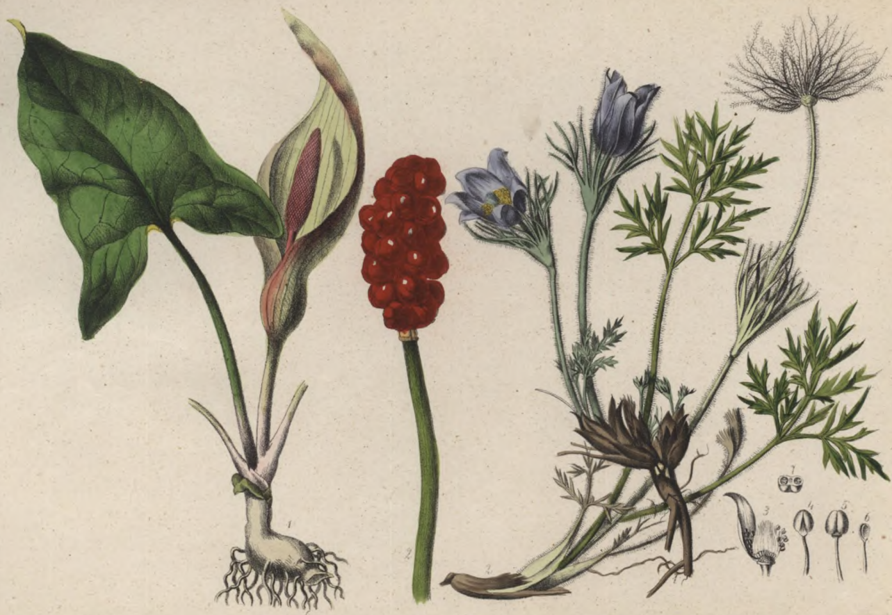
Gefleckter Aronsstab. Aron blamatý Arum maculatum .