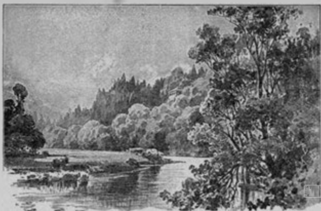
Rizenburk a údolí Babiččino.