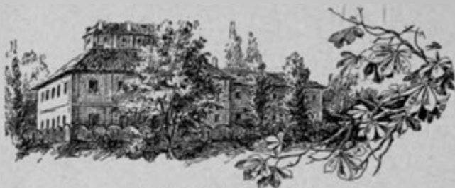
Knížecí zámek v Ratibořicích.