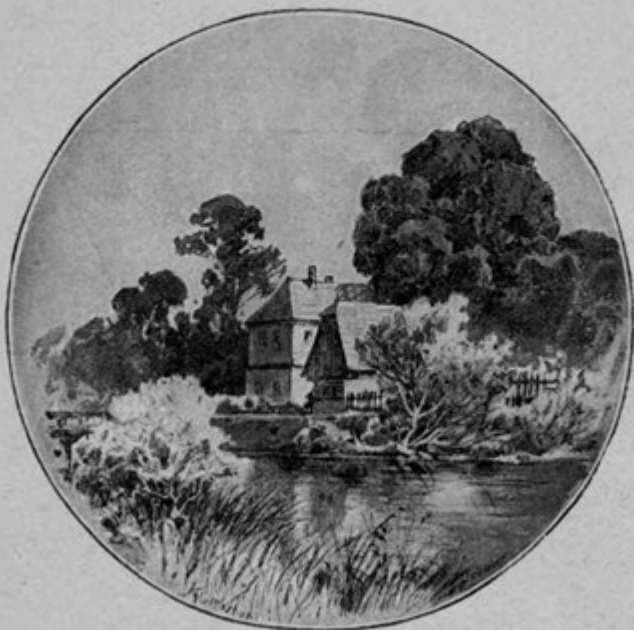
Staré bělidlo v Ratiboricích.

k východu, táhla se vinná réva, před okny pak byla malá zahrádka, plná růží, fial, resedy i salátu, petrželky a jiné drobné zeleniny. Na severovýchodní straně byl ovocný sad, a za ním táhla se louka až ke mlýnu. Veliká stará hruška stála při samém stavení, kladouc se všemi svými ratolestmi na šindelovou střechu, pod níž hnízdilo mnoho vlaštovic. Uprostřed dvorku stála lípa, pod ní lavička. Na jihozápadní straně bylo menší stavení hospodářské, za tím táhlo se chrástí a křoví až ke splavu na horu . . . Od stavení přes strouhu byl mostek na stráně, kde byla pec a sušárna. « Jak zestárla od dob babiččiniých také tato chaloupka!