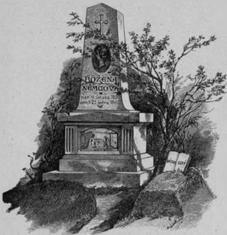
Pomník B. Němcové na hřbitově vyšehradském.