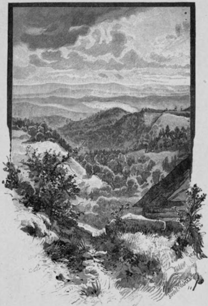
Orlické pohoří. (Pohled od pruských hranic.)