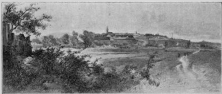
Josefov. (K historii o tolarn.)