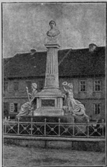
Pomník Boženy Němcové v České Skalici.

Avšak trvalejší pomník, nežli tyto kamenné, postavila si Němcová v srdcích národa jako neohrožená jeho buditelka a spisovatelka ceny nepomíjející. Obraz její odtisknut v duši národa v plné svěžesti a barvitosti, a dokud zdráva zůstane, dotud bude žít v ní!