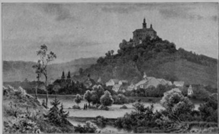
Město a zámek Náchod.