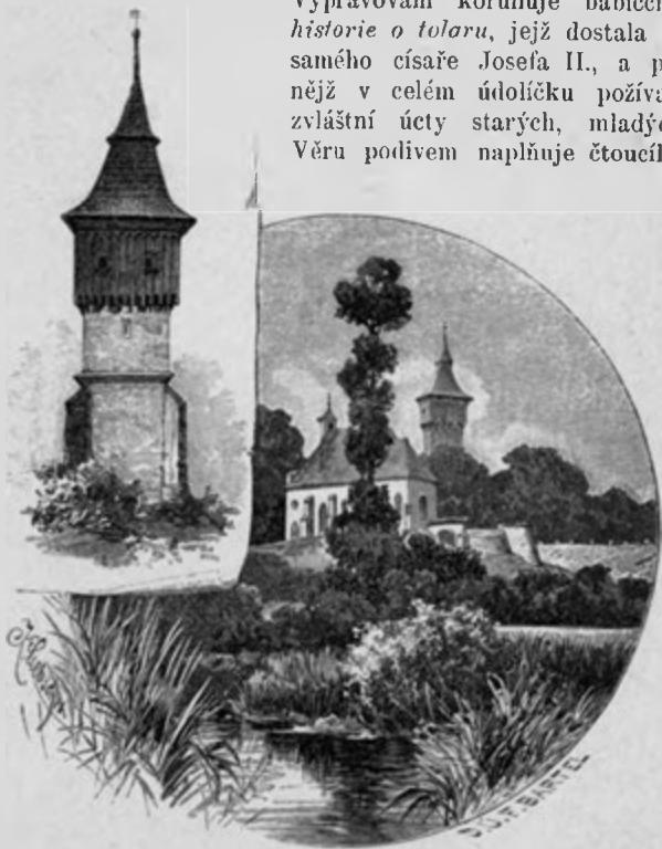
Věž a kostel v Krčíně.

Odpolední besedu ve mlýně vypravuje Němcová tak rozmarně, že patrně viděti, jak ráda v době své nejkrutější bídy, kdy Babičku psala, kochala se vzpomínkami bezstarostného a zlatého svého mládí. Do té besedy vložila nejen zábavu nedělní lidí dospělých, ale i hry dětí způsobem zajisté velice obratným. Vypravování korunuje babiččina historie o tolaru , jež dostala od samého císaře Josefa II., a pro něž v celém údolíčku požívala zvláštní úcty starých, mladých. Věru podivem naplňuje čtoucího.