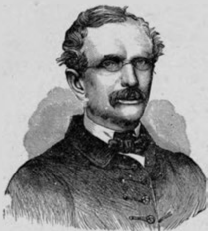
Karel Jaromír Erben.

aby jí jednak bděla nad milými dítkami, jednak se s ní potěšila a také slušnějšího vzdělání jí zjednala, než možno bylo ve Chvalkovících.