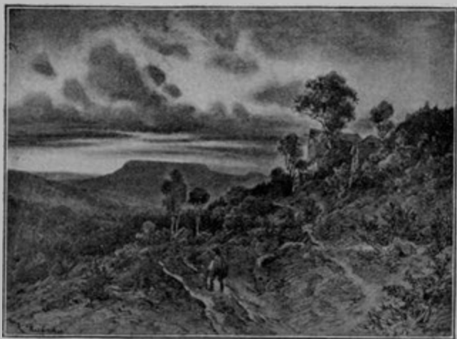
Krajina u Olešnice.

babička i děti učila. Leželo-li na cestě husí peříčko, babička hned na ně ukázala řkouc: »Shýbni se, Barunko!« Barunka byla mnohdy líná a říkala: »Ale, babičko, co pak je o jedno píрко?« Ale z toho ji babička hned kárala: »Pomysli si, holka, sejde se jedno ke druhému, bude jich několik; a to si pamatuj přísloví: Dobrá hospodyňka má pro píрко přes plot skočiti.« 5)