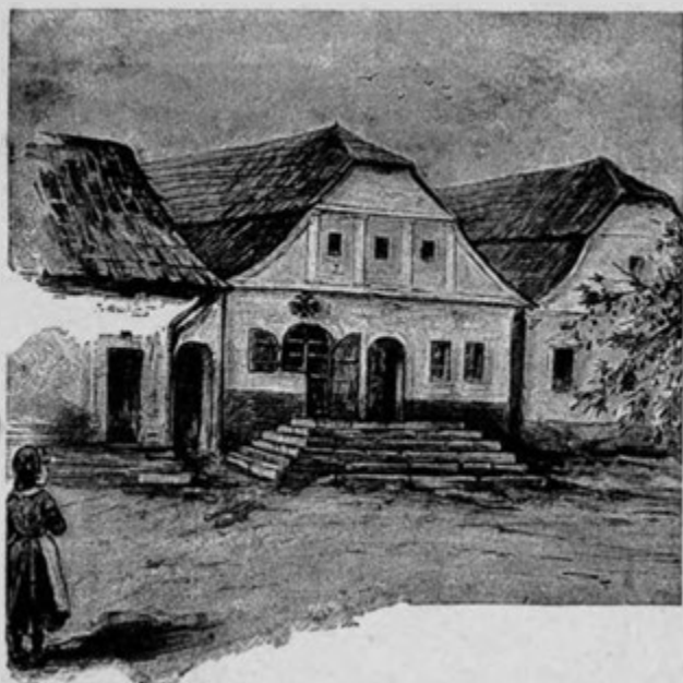
Dům kupce Hulka v Červ. Kostelci.

kabátku, dlouhé sukni, mající červený hedvábný šátek uvázaný na hlavě. Sedíc u vysokého kolovrátku tak zvaného kozlíku, předla len. Ihned vedle ní protahoval se mourovatý kocour. U nízkých kamen, při nichž i plotna byla, seděl na lavici domácí pán, nevelký, spíše hubený než tlustý, snědé tváři, ale velmi dobrého vzezření. Měl na sobě tmavomodrou kazajku, též takovou vestu i spodky dole vyhrnuté, bílý šátek na krku, pantofle a na hlavě aksamítovou čepičku na způsob malé homole cukru, kterou, když jsem přišla, smekl. Pod čepičkou se mu kroužilo na