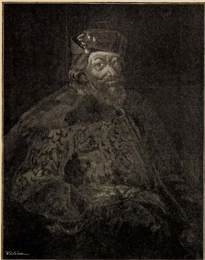
Heřman hrabě Černín z Chudenic.