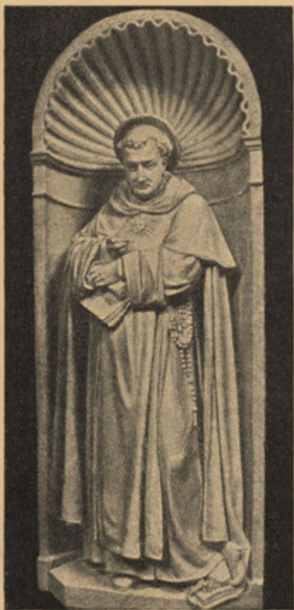
Sv. Tomáš Akvinský.