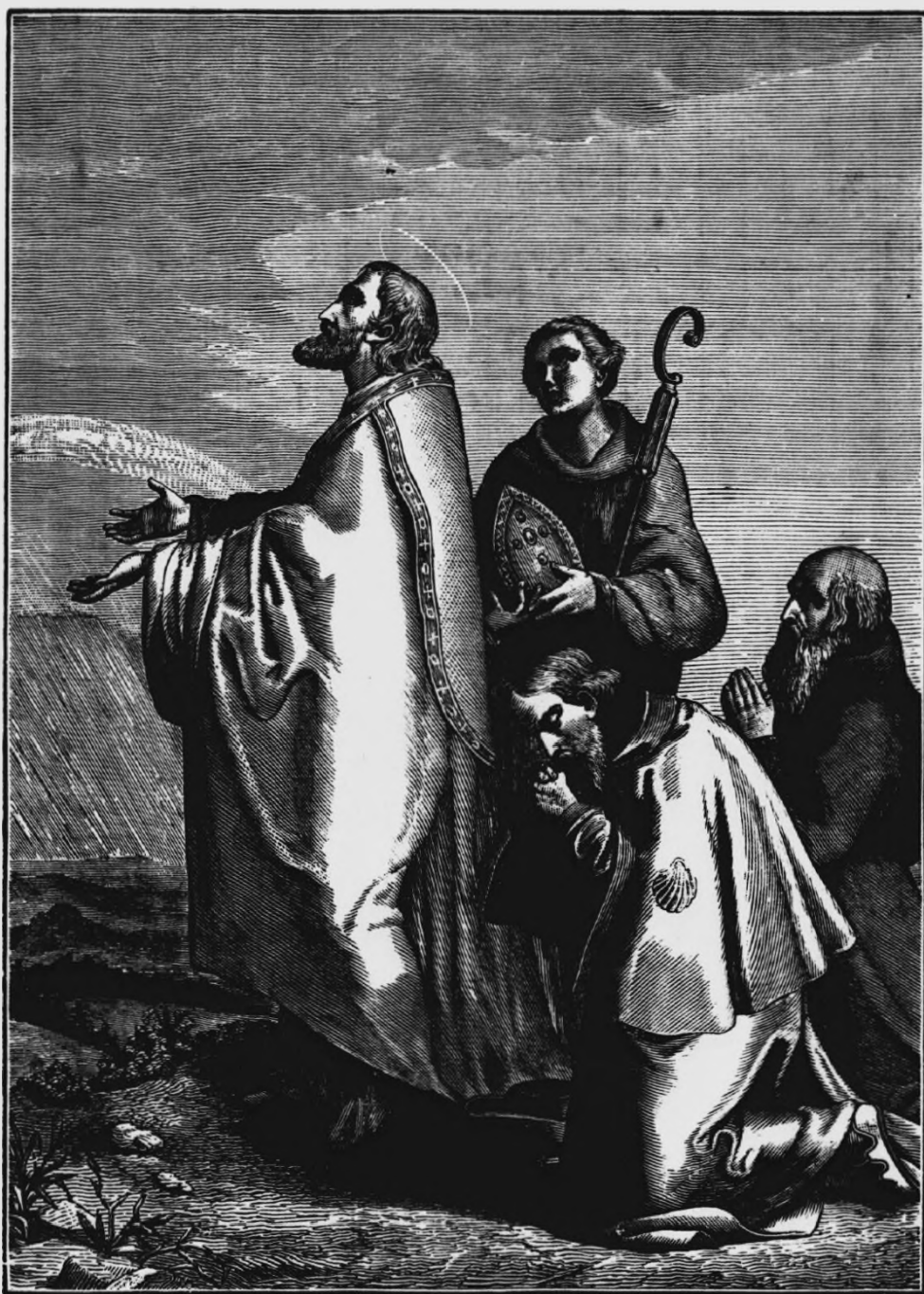
Sv. Vojtěch, druhý biskup Pražský a patron zemský.